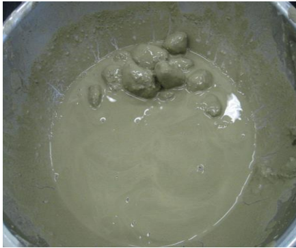
TG パリック II 単独使用 低注入率において 土塊を分散化させることが可能