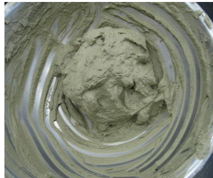
TG パリック II + TG ジェル併用使用 極度に泥水化することなく 良質の排出土に改良できる