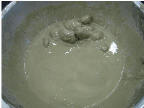
<TG パリックⅢ単独使用>