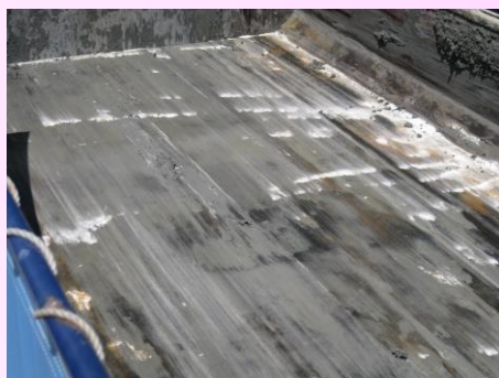
土砂荷降ろし後 土砂の付着無し