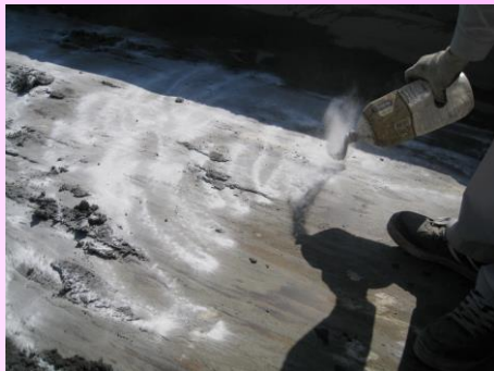
ダンプ荷台にマッドスベールを適量散布

マッドスベールは、この土砂の付着を防止することができる、環境対応型薬剤であり、少量添加にて十分な効果を発揮します。