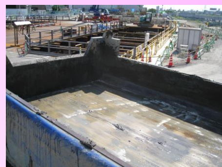
1 度マッドスベール散布すれば 数回は散布不要 ⇒効果の持続性有り