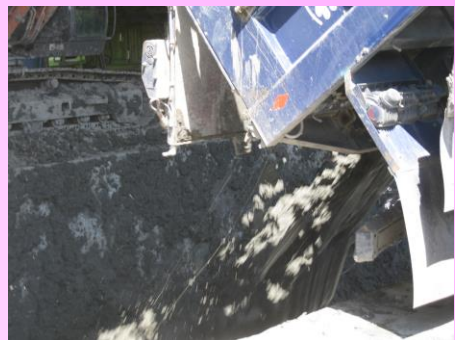
土砂が勢い良く滑り落ちる