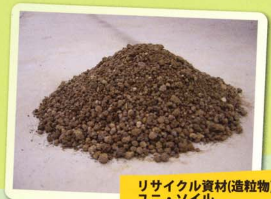
リサイクル資材(造粒物) ユニ・ソイル

注)この土砂が汚泥かの判断は、掘削工事に伴って排出される時点で行うものとする。掘削工事から排出されるとは、水を利用し地山を掘削する工法においては、元の水と土砂を分離するま出を掘削工事としてとらえ、この一体となったシステムから排出される時点で判断することとなる。