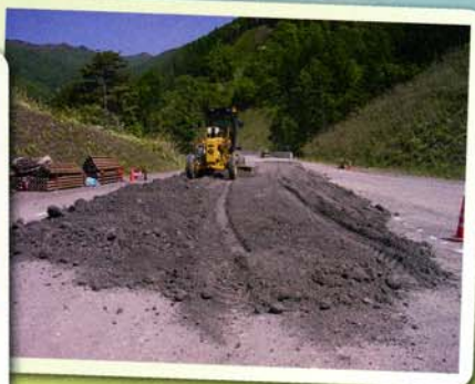
361権兵衛トンネル伊那工事