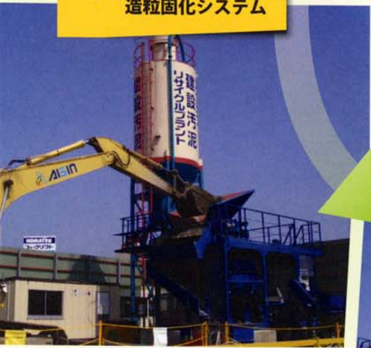
造粒固化システム