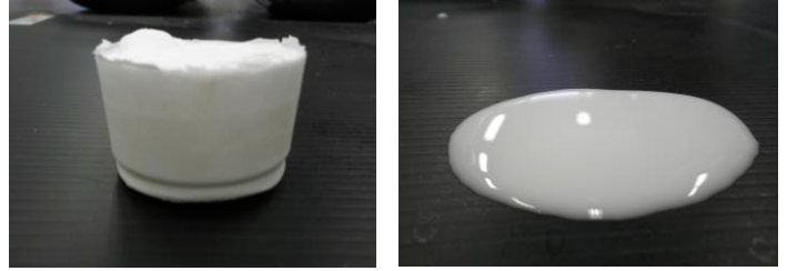
-15℃におけるダストシャット(左)とダストシャット15(右)

ダストシャット15 : 寒冷地においても使用可能(-15℃でも凍らない規格をクリアしている製品)です。実際に製品を水で希釈して使用する際は、希釈後すぐに使用するか、ミキサーによる攪拌で流動性を持たせるか、希釈タンクにカバーするなどの保温環境にてご使用ください。