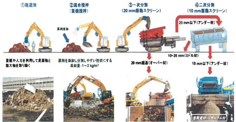
図2. 災害廃棄物分別処理での適用フロー

土砂の雨水による再泥化抑制、振動篩等のスクリーンに対する目詰まり防止効果も発揮(写真2参照)。分別作業の手間や作業時間を省くことが可能だ。