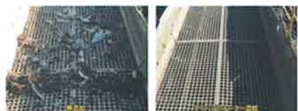
写真2. 振動篩機スクリーンの目詰まり比較