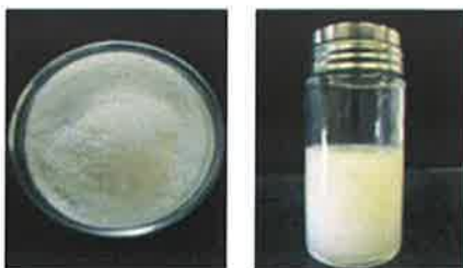
写真1. クリーンウォーター ®