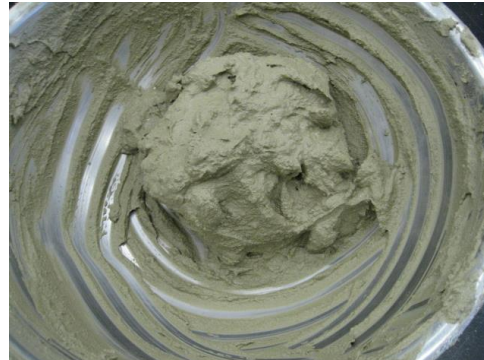
<TG パリックⅢ+TG ジェル併用使用>