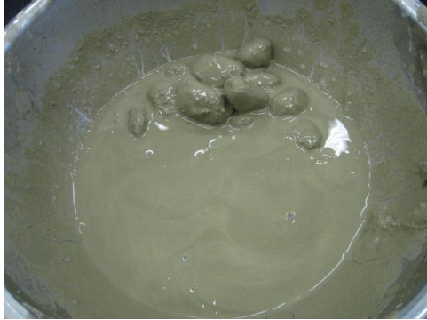
<TG パリックⅢ単独使用>